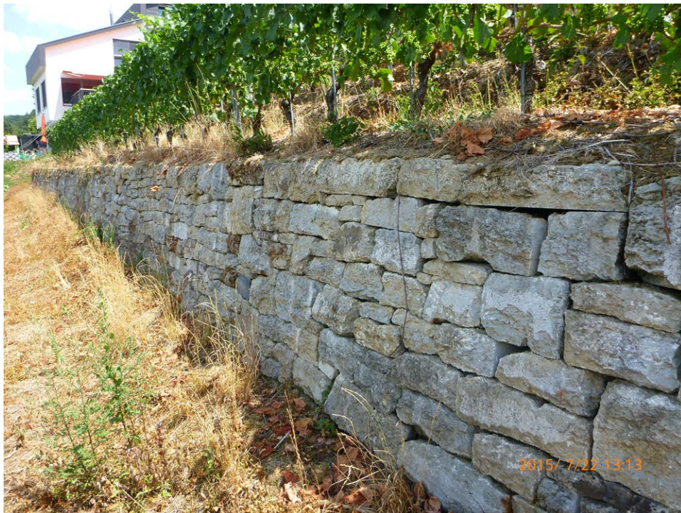
Photos de l'objet 22.07.2015